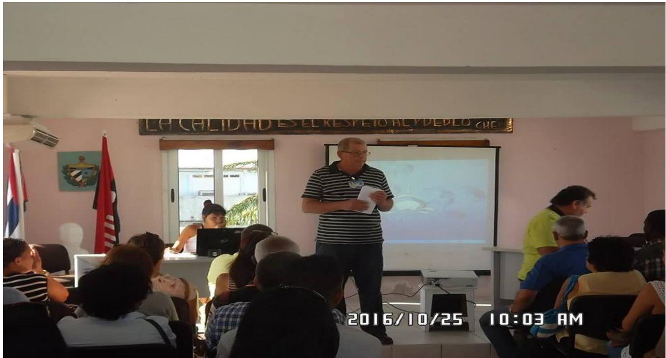
Incorporación de la empresa pesquera al proyecto