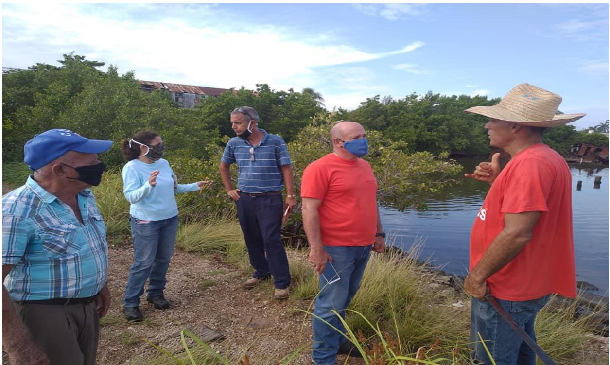
Participación de líderes formales e informales en el cuidado y conservación de las zonas del litoral