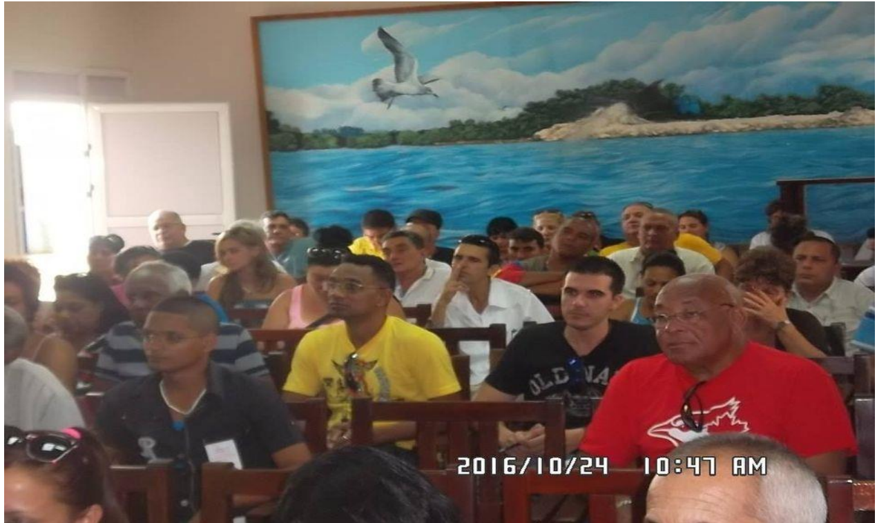
Interese comunes desde el punto de vista de realizacion por parte de las emisoras implicadas en el proyecto