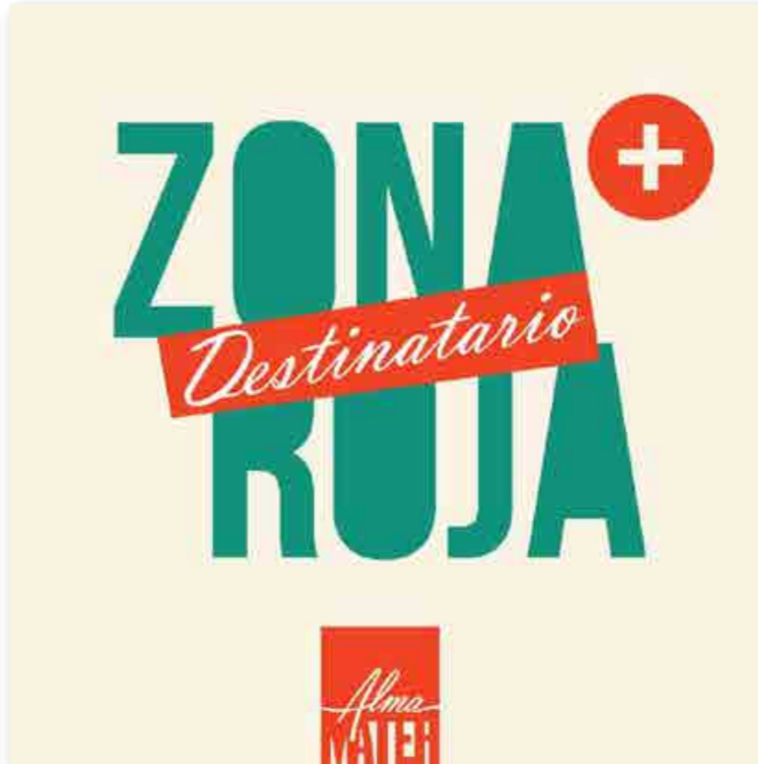
Destinatario Zona Roja